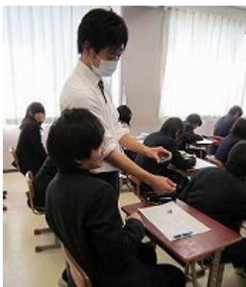
図3 生徒の解答を取り込む様子

開発したシステムの評価実験として、高等学校にて高校1年生を対象に実際に授業（「数学」単元「場合の数と確率」）の演習時間と補習の時間において期末試験前の二週間使用した（図3、図4）。その後実際に使用した教員から感想を聞いた。